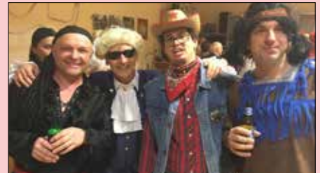
Zu Fasching nahmen die Narren unser Musikheim in Besitz. Es wurde gefeiert und man vergnügte sich bis spät in die Nacht mit Krapfen, Würstel und guter Musik.