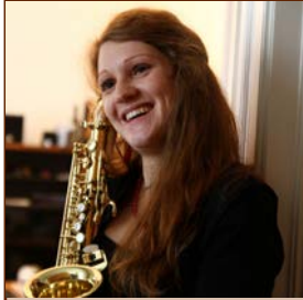
GERT Silke Masterstudium im Fach Saxophon Populärmusik IGP