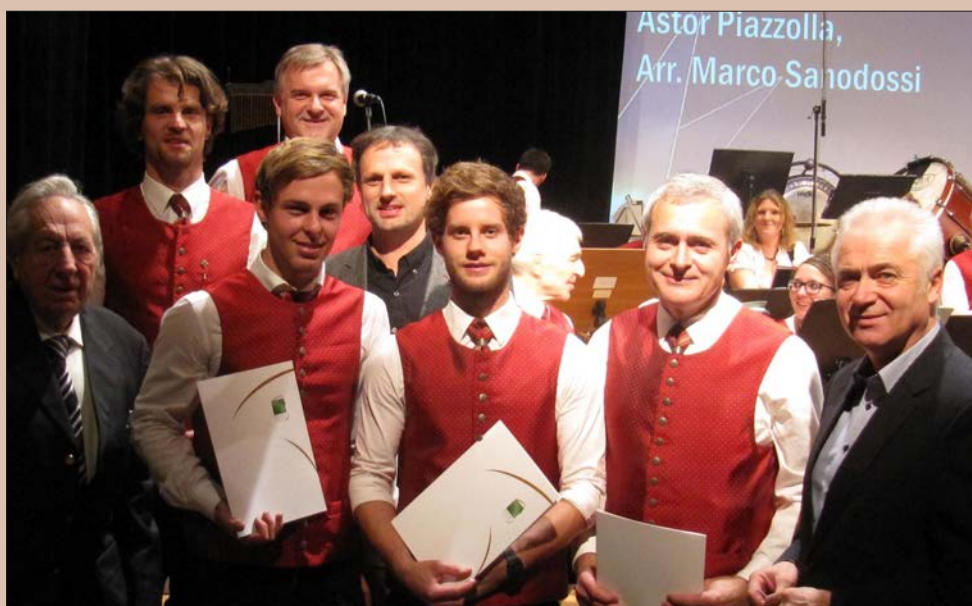
Ehrung verdienstvoller Musiker