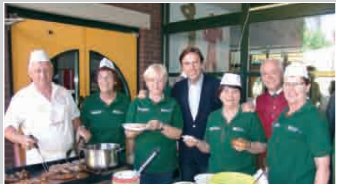
LH Voves und Bgm. Leitenberger in der Küchenzentrale