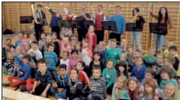
Vorspielstunde in den örtlichen Schulen