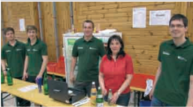
Unsere fleißigen Helfer