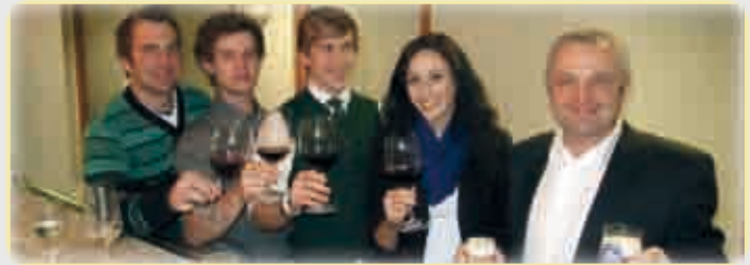
...in geselliger Runde...