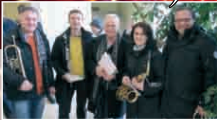
Bürgermeister Helmut Leitenberger