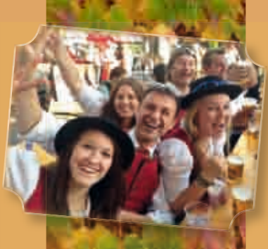
Voller Einsatz beim Südsteirisches Herbstfest in Leibnitz