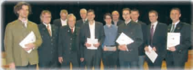
Ehrung verdienstvoller Mitglieder

Mit einer schönen Feier beendeten wir im Kulturzentrum Leibnitz das Jahr 2012.