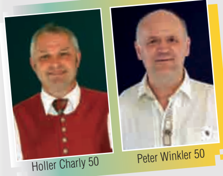
Holler Charly 50