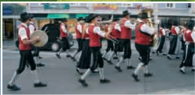
Einmarsch zum Festgelände