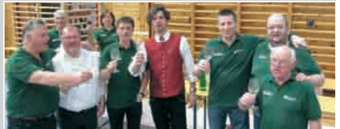
Ein Prosit auf die gelungene Veranstaltung