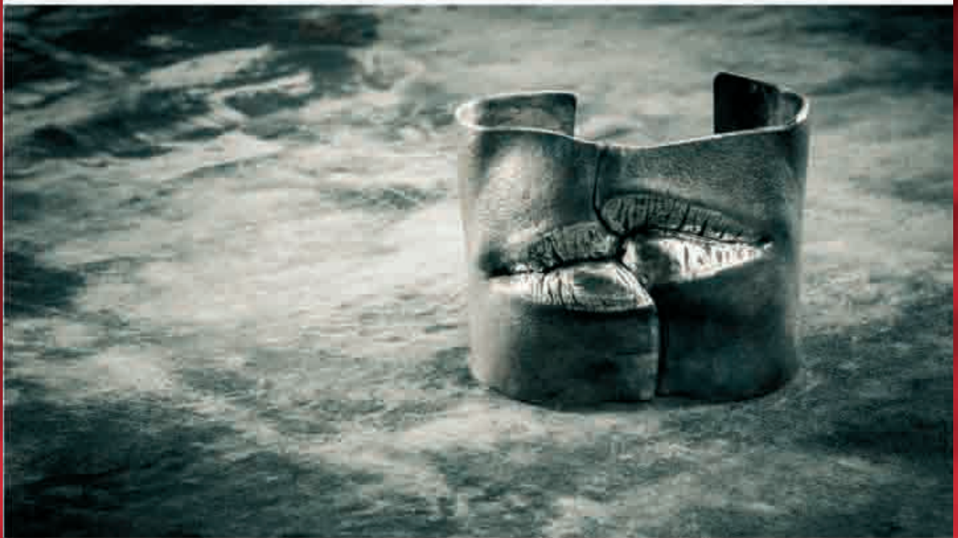
"die Liebenden" persönlicher Hautabdruck | Silber | Armreifen Objekt | 2012

"...ein handgefertigtes Einzelstück umgibt eine Aura, die ein Massenprodukt nie haben kann..."