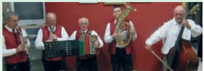
After Konzert Party