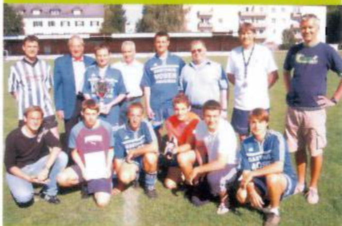
Die Sieger: MV Seggauberg