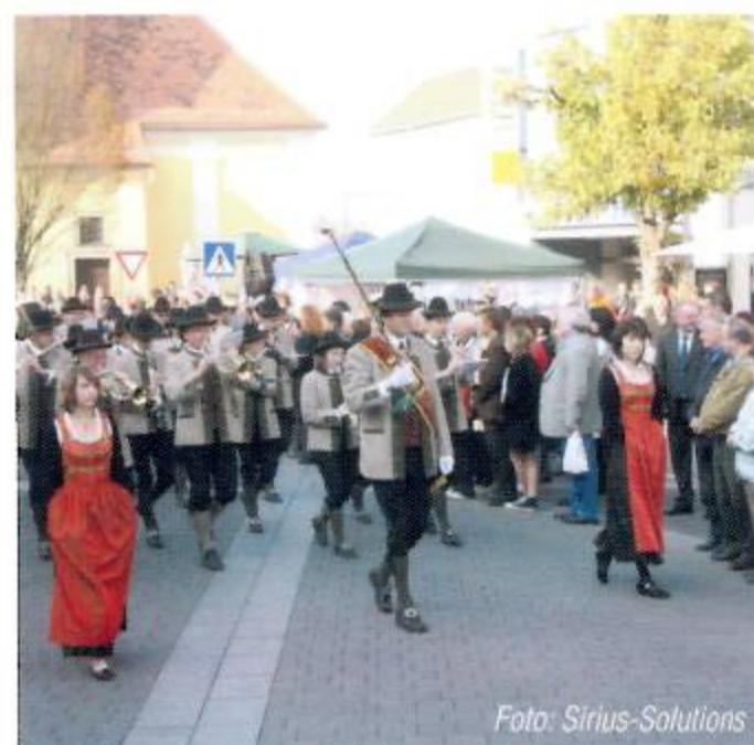
Einzug mit der Erntekrone