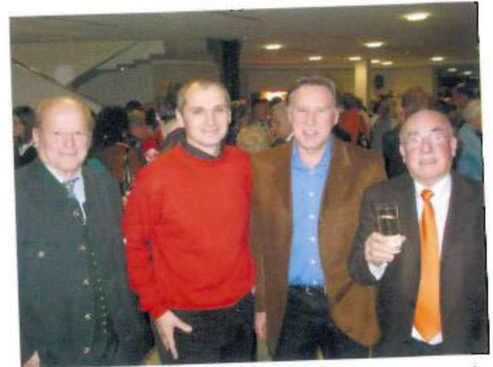
Ständige Gäste beim Weihnachtswunschkonzert: ehemalige Musiker der Stadtkapelle