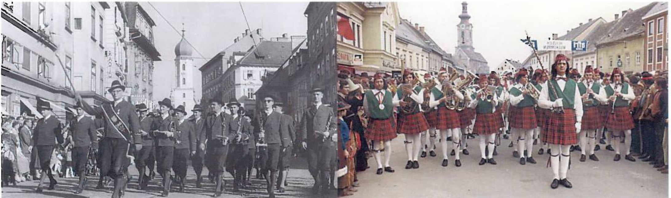
Die Stadtkapelle Leibnitz beim Landesmusikfest Graz in den sechziger Jahren