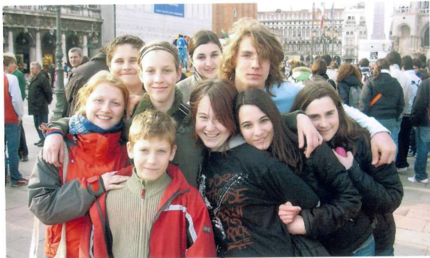
Sie verstehen sich einfach glänzend! Die Jugend der Stadtkapelle Leibnitz. Hier beim Konzertausflug in Mira bei Venedig.