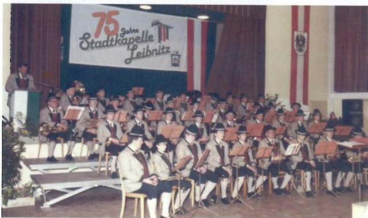
Die Stadtkapelle Leibnitz feierte 1985 das 75-jährige Jubiläum mit einem großen Festkonzert!