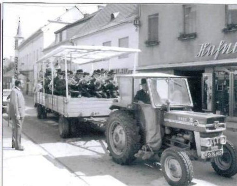
Muttertagsständchen 1975 einmal anders!