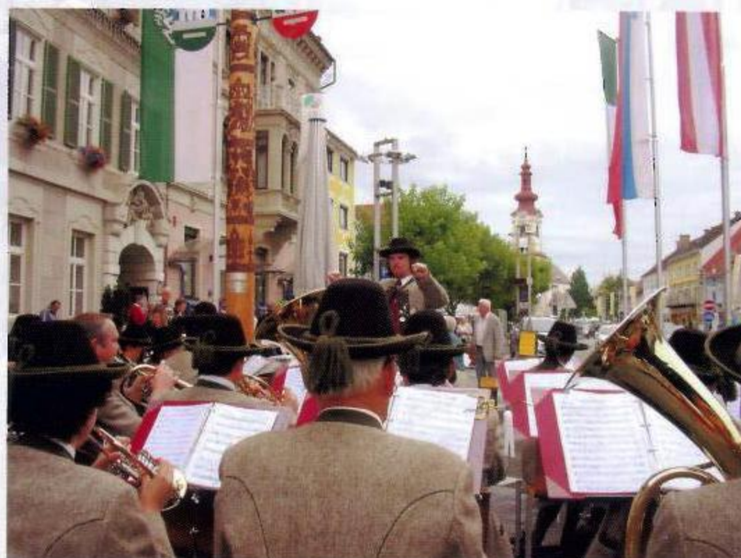
9.7.2005 Tag der Blasmusik, Konzert am Hauptplatz