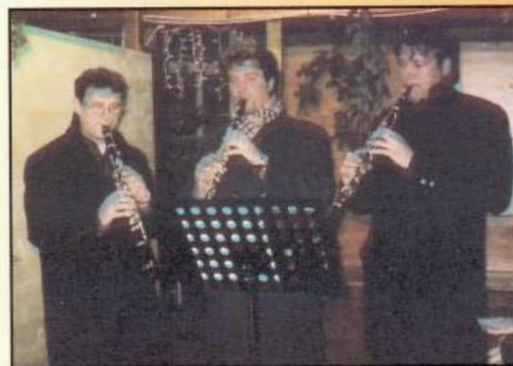
Dez. 2004; Teilnahme am Adventsmarkt am Hauptplatz