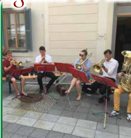
Die Gartenmusik, Prima la Musica, Bezirkswettbewerb BIG GIG, Leistungsstufe D, 1. Preis 2020